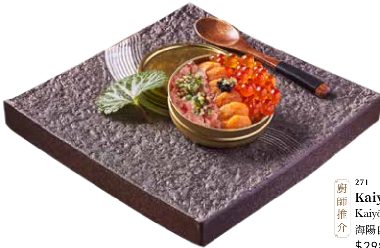
271 廚師推介 Kaiyō 壽司 Kaiyō Sushi 海陽自家製すし $298