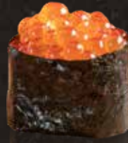
104 三文魚籽 $52 Salmon Roe イクラ軍艦