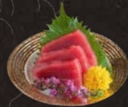
120 吞拿魚背 $118 Tuna マグロ赤身刺