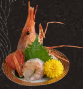
106 牡丹蝦 $128 Botan Shrimp ボタン海老刺