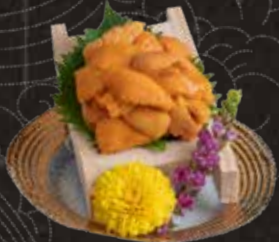
119 海膽 $288 Sea Urchin 生ウニ刺