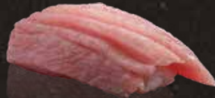
228 大吞拿魚腩 $138 Prime Fatty Tuna 極上大トロ