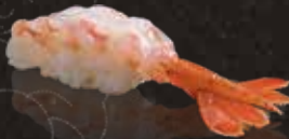
230 牡丹蝦 $128 Botan Shrimp ボタン海老