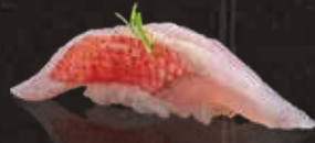
229 金目鯛 $58 Golden Eye Sea Bream キンメダイ