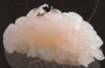
232 白蝦 $108 White Shrimp 白えび