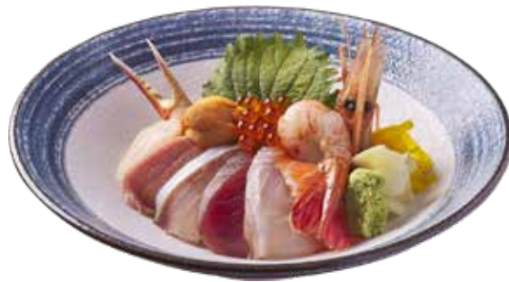
718 海鮮丼 (人気) Kaisen Don 豪華海鮮丼 $368