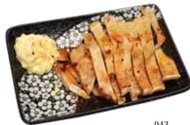
043 新品 燒七味魚翅 Shichimi Shark's Fin エイヒレの炙り焼 $78