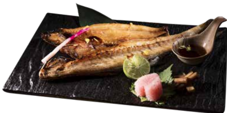
420 廚師推介 燒自家製馬友一夜乾 Grilled Japanese Threadfin Fish 自家製馬友一夜干し $348