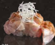
240 炙炙大吞拿魚腩 $148 Aburi Prime Fatty Tuna 炙り大トロ赤身