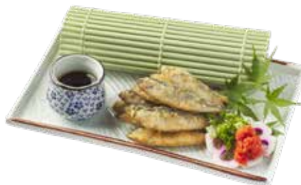
027 唐揚小池魚 Grilled Baby Mackerel イワシの竜田揚げ $78