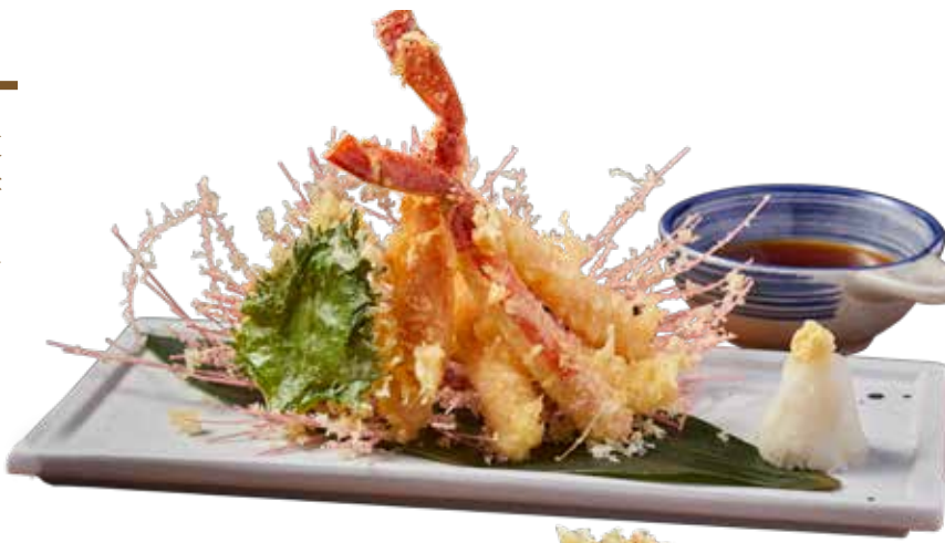
509 松葉蟹天婦羅 Snow Crab Tempura 松葉カニ天ぷら $248