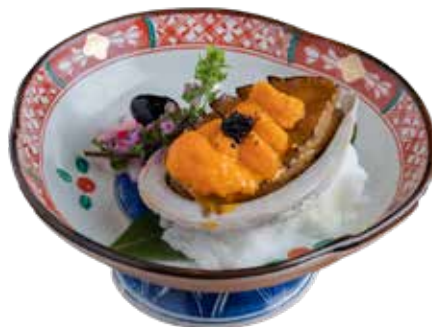
425 海膽鮑魚燒 新品 Grilled Abalone with Sea Urchin 超豪華アワビウニ焼き $298