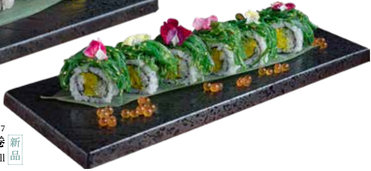
287 健康海藻牛油果卷 Healthy Wakame Avocado Roll ヘルシーわかめアボカドロール $108