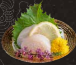
110 北海道帶子 $88 Hokkaido Scallops 北海道ホタテ刺