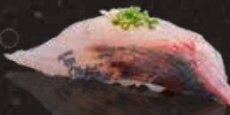
217 深海池魚 $48 Striped Jack シマアジ