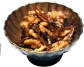
005 人氣 核桃小女子 Glazed Dried Sardines with Walnuts くるみ小女子佃煮 $58