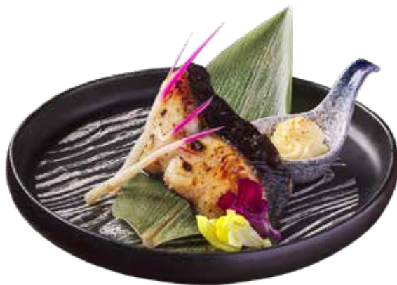
427 鹽燒吞拿魚下巴 新品 Salt-Grilled Tuna Jaw ブリカマの塩焼き $228