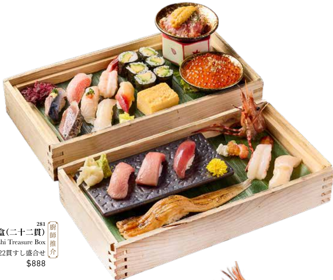
281 廚師推介 海陽極尚壽司盛盒(二十二貫) Kaiyō Supreme Sushi Treasure Box 海陽極上22貫すし盛合せ $888