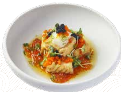
023 炸京都豆腐伴黑魚籽 Kyoto-style Fried Tofu with Caviar 京都風揚げ出し豆腐 $88