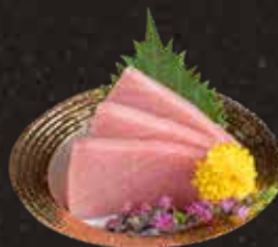
121 中吞拿魚腩 $298 Semi-Fatty Tuna 中トロ刺