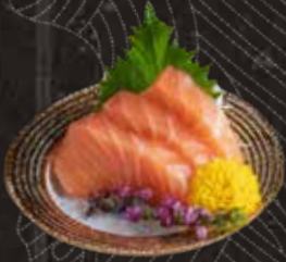
105 三文魚 $88 Salmon サーモン刺