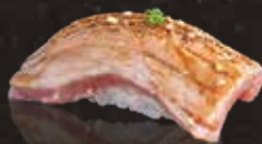
239 炙炙吞拿魚中腩 $118 Aburi Semi-Fatty Tuna 炙り中トロ