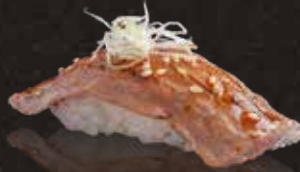
238 炙炙A4和牛 $98 Aburi A4 Wagyu Beef 炙りA4和牛