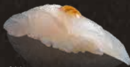
214 左口魚 $42 Flounder ヒラメ