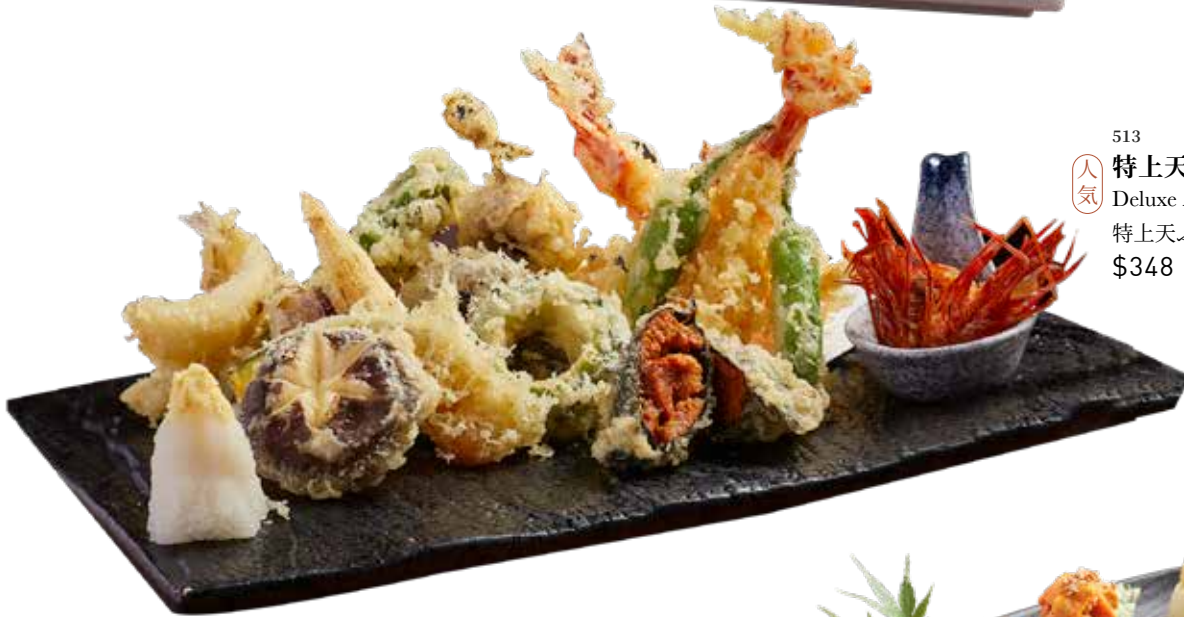
513 特上天婦羅盛 Deluxe Assorted Tempura 特上天ぷら盛り合わせ $348