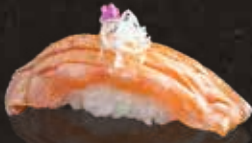
236 炙炙三文魚 $48 Aburi Salmon 炙りサーモン