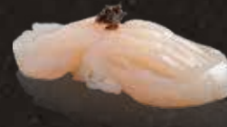
224 北海道帶子 $88 Hokkaido Scallops 北海道ホタテ