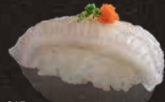
215 左口魚邊 $42 Flounder Fin えんがわ