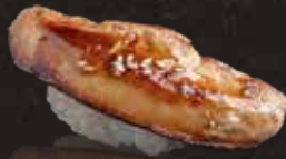
204 炙炙焦糖鵝肝 $98 Aburi Foie Gras 炙りキャラメル安肝