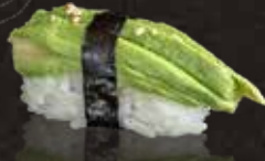
220 牛油果 $28 Avocado アボカド