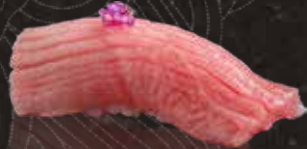
227 中吞拿魚腩 $108 Semi-Fatty Tuna 極上中トロ