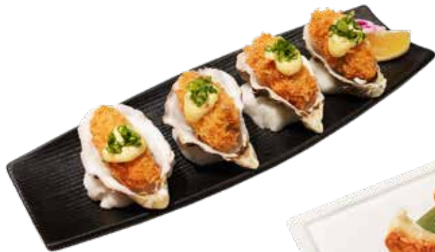
020 吉烈廣島蠔 Deep Fried Jumbo Oysters 大粒の広島産カキフライ $78