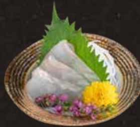
115 左口魚薄切 $148/5pcs Thinly-sliced $268/10pcs Flounder ヒラメ薄きり刺