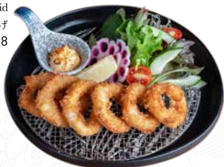
022 炸魷魚圈 Deep Fried Squid イカリングの唐揚げ $78