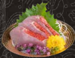
111 金目鯛 $138 Golden Eye Sea Bream キンメダイ