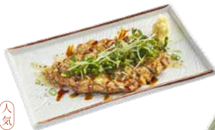
025 炸日本小權淮山魚餅 Fried Yam and Fish Cake 山芋の磯辺揚げ $78