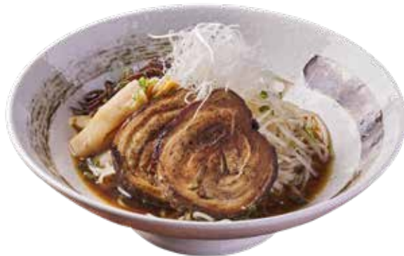
806 札幌味噌叉燒拉麵 Japanese Grilled Char Siu Ramen in Miso Broth 札幌チャーシューメン味噌 $148