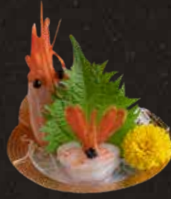
107 北海道牡丹蝦 $138 Hokkaido Botan Shrimp 北海道ボタン海老刺