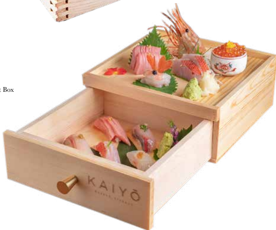
282 新品 吞拿魚拖羅壽司盛盒(六貫) Toro Sushi Assortment Box (6 pcs) マグロの腹すし盛り合わせ $528