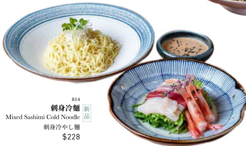
814 新品 刺身冷麵 Mixed Sashimi Cold Noodle 刺身冷やし麵 $228