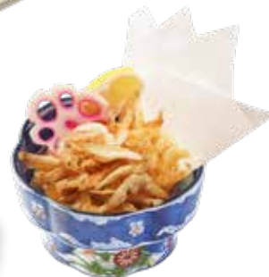
028 炸富山小白蝦 Deep Fried White Shrimps 富山風小海老揚げ $78