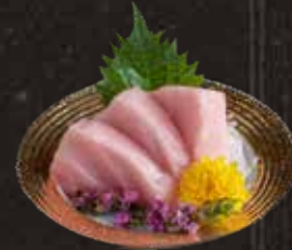
122 大吞拿魚腩 $368 Prime Fatty Tuna 大トロ刺