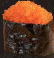
103 蟹籽 $32 Crab Roe 飛び子v