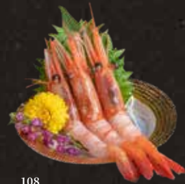
108 甜蝦 $98 Sweet Shrimp 甘エビ刺