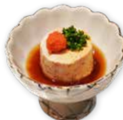
026 鮫鱈魚肝 Angler Fish Liver あん肝ポンズ $138