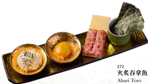
273 三文魚籽自創壽司 Salmon Roe いくら $128