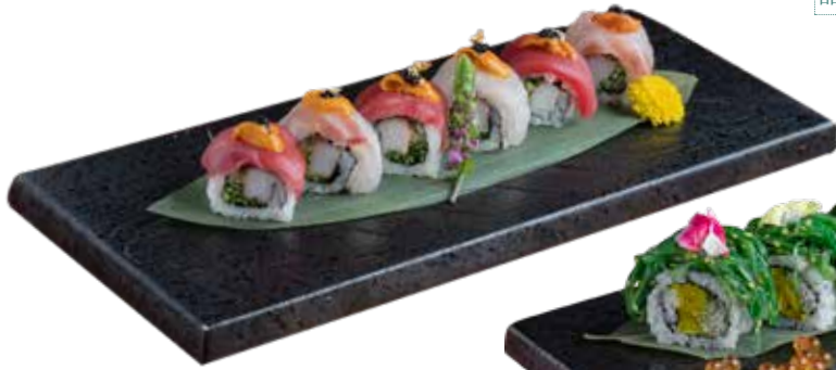
289 海膽雙色卷 Sea Urchin Duo-Sashimi Roll ウニ2色ロール $198