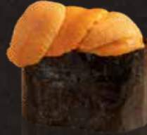
120 海膽 $108 Sea Urchin ウニ軍艦