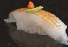
237 炙炙左口魚邊 $52 Aburi Flounder Fish 炙りエンがわ