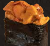
121 日本海膽 $138 Japanese Sea Urchin 生ウニ軍艦