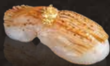
276 炙炙北海道帶子 $98 Aburi Hokkaido Scallop 炙り北海道ホタテ