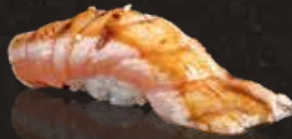
275 炙炙三文魚腩 $58 Aburi Salmon Belly 直火炙りキングトロサーモン