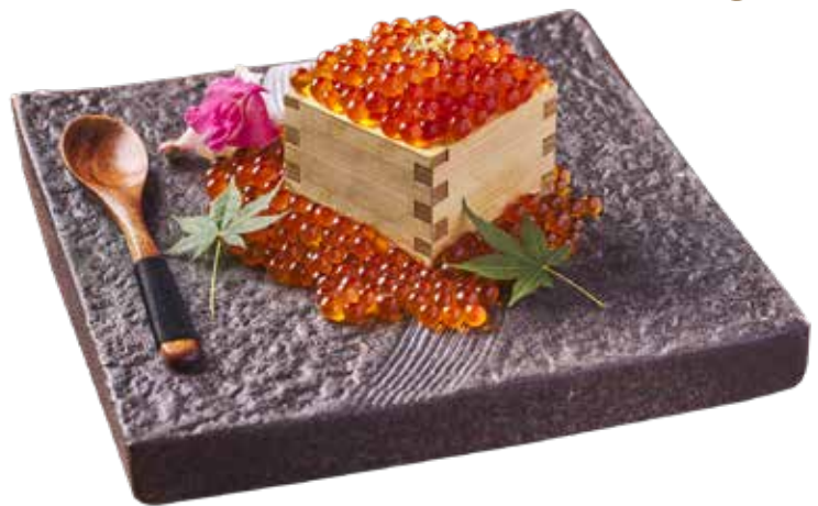
207 三文魚籽小盛盒 Salmon Roe Treasure イクラ寿司軍艦ボックス盛り $198