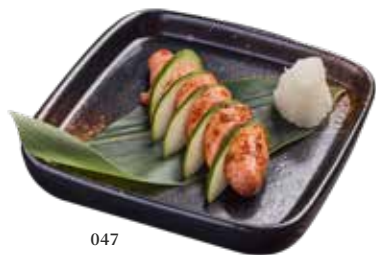
047 焼明太子 Grilled Mentaiko 焼き明太子 $108