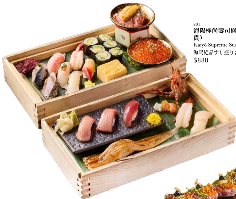
281 海陽極尚壽司盛盒 (二十二貫) Kaiyō Supreme Sushi Treasure Box 海陽絶品すし盛り合わせ 22貫 $888