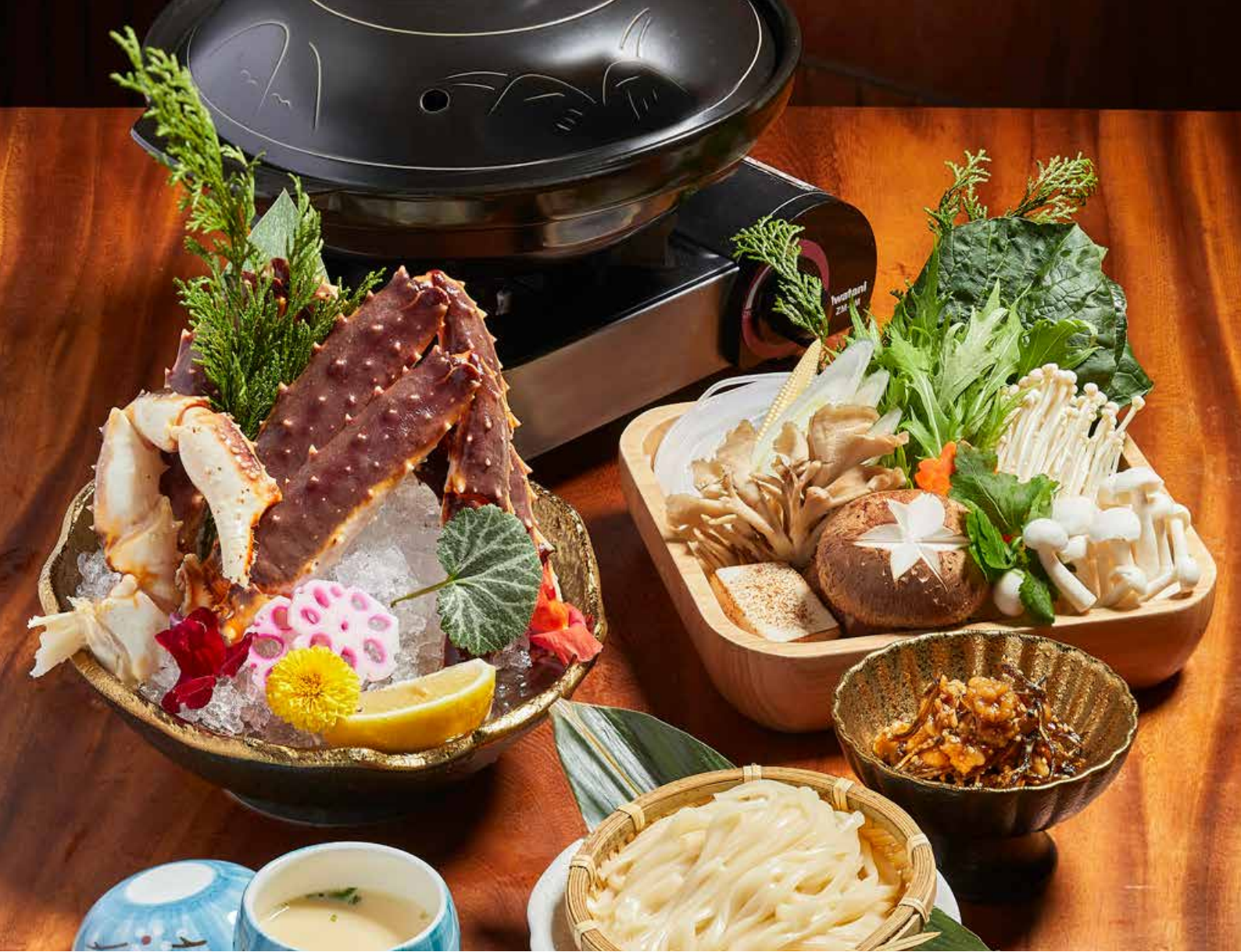
604 龍蝦什錦海鮮鍋 Lobster Premium Seafood Pot 伊勢エビ海鮮鍋