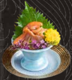
109 赤貝 $98 Ark Shell 赤貝刺