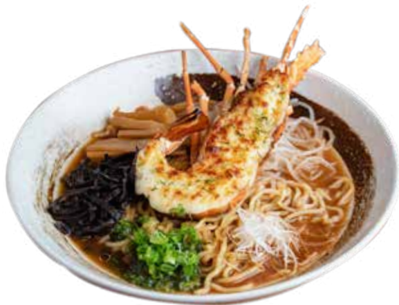
812 新品 濃湯龍蝦味噌拉麵 Grilled Lobster Ramen in Miso Broth ロブスター味噌ラーメン $268