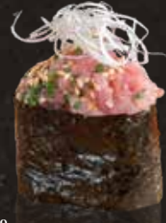
119 碎蔥吞拿魚腩 $48 Minced Toro ネギトロ