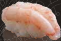
222 甜蝦 $68 Sweet Shrimp 甘エビ