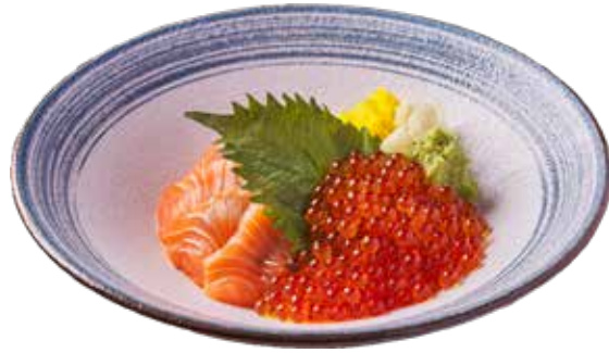
713 三文魚親子丼 Salmon Ikura Don サーモントロトロ親子丼 $198