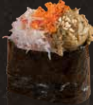
277 蟹肉蟹膏 $58 Crab Meat and Crab Roe カニ肉とカニ味噌