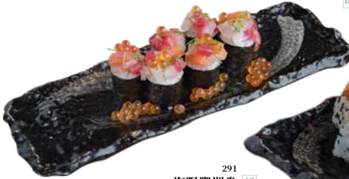
291 海陽豐洲卷 KAIYŌ Toyosu Roll 海陽自家製豐洲卷 $198