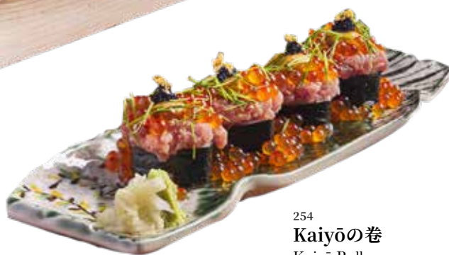
254 Kaiyōの巻 Kaiyō Roll 海陽自家製巻き $368