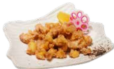
012 唐揚雞軟骨 Crispy Fried Chicken Cartilage 鶏なんこつ唐揚げ $58