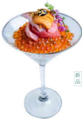
271 新品 拖羅花壽司馬天尼 Toro Flower Sushi Martini トロ花すしまティーニ $398