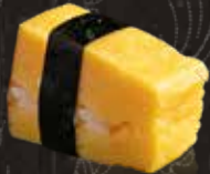
279 玉子焼 $28 Tamago ふわふわ太陽卵焼き