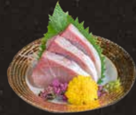
114 油甘魚 $118 Yellowtail ハマチ刺