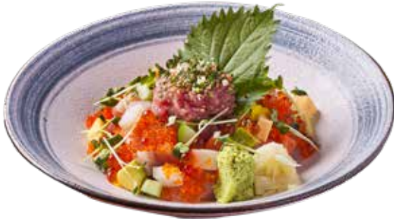
723 新品 柚香粒粒魚生丼 Chirashi Don 海鮮ちらし丼 $248