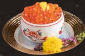
113 三文魚籽 $118 Salmon Roe イクラ刺