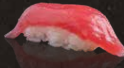
226 吞拿魚背 $48 Tuna 天然南中トロ・赤身