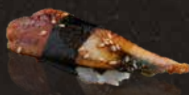
280 蒲燒鰻魚 $48 Grilled Eel 鰻蒲焼