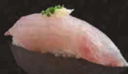
210 真鯛 $42 Sea Bream マダイ