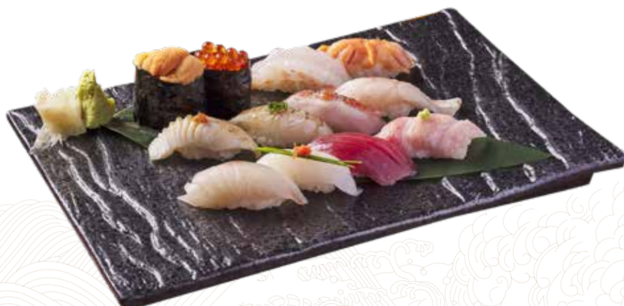
201 上壽司盛(六貫) Assorted Sushi Platter (6 pcs) 上すし6貫盛合せ $268