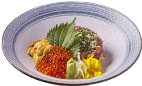
719 廚師推介 特上三色丼 (吞拿魚腩蓉, 三文魚籽, 海膽) Deluxe Trio Don (Toro, Ikura, Uni) 特上海鮮3色ネギトロ、イクラ、ウニ丼 $398