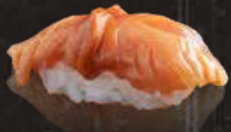
223 赤貝 $98 Ark Shell 赤貝