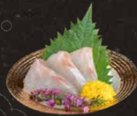
112 真鯛薄切 $108/5pcs Sea Bream $188/10pcs 真鯛薄きり刺