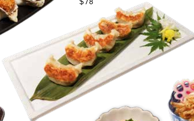
014 焼猪肉餃子 Pan-Fried Pork Gyoza 豚肉焼き餃子 $68