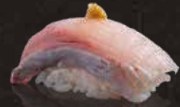
216 油甘魚 $42 Yellowtail はまち