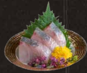
116/118 深海池魚 $128/3pcs 深海池魚(薄切) $268/10pcs Striped Jack / Thinly-sliced シマアジ刺