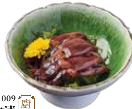
009 螢光魷魚沖漬 Small Cuttlefish in Soy Sauce ホタルイカ沖漬け $68