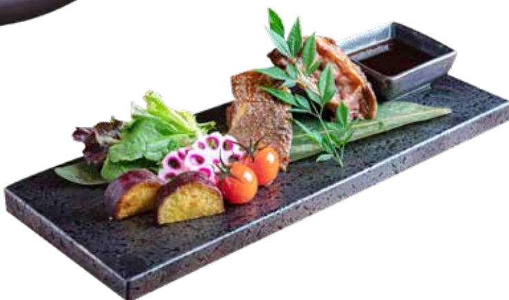
419 人気 石野白味噌銀鱈魚西京燒 Grilled White Miso Silver Cod Fish 銀たら西京焼き $298