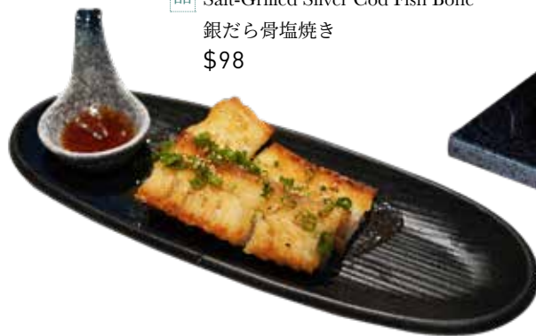
045 鹽焼銀鱈魚骨 Salt-Grilled Silver Cod Fish Bone 銀だら骨塩焼き $98